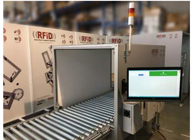
Mod TVsc - Half Vers. rulli a nastro